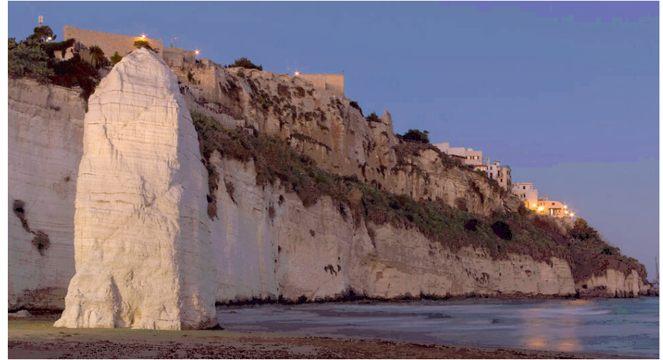
Il monolite del Pizzomunno