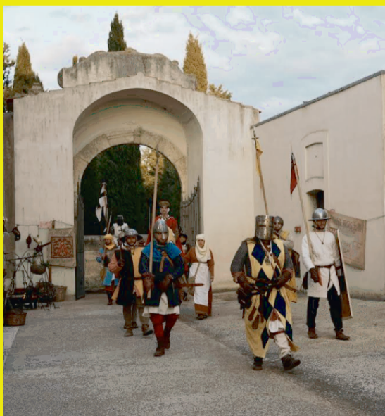
La rievocazione a Torre Alemanna