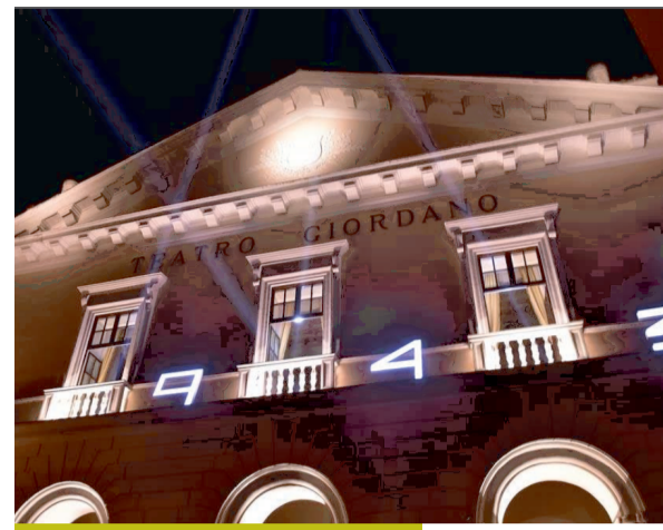
Installazione luminosa di qualche anno fa