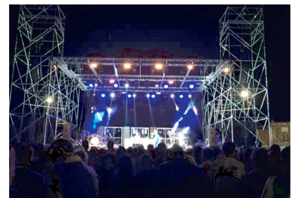
Mega palco in Via Piemonte

D a oggi al 30 maggio la città di Orta Nova ospita il "Reali Siti Festival 2026", un evento di musica, spettacolo ed emozioni, promosso dalla Pro Loco di Orta Nova e da Di Salvatore Music Group con il patrocinio del Comune di Orta Nova. In Via Piemonte, nella città capofila dei Reali Siti, sarà allestito un mega palco, che ospiterà tre giorni di musica e divertimento.