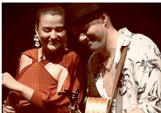
Il Duo Lume

D omani 29 maggio, il "Duo Lume" è protagonista di InConcerto XXII al Museo delle Arti e Tradizioni "M. Capuano", in Largo Piazza De Mattias a San Giovanni Rotondo con il programma S(w)inging & Picking. Con loro, le prelibatezze e i presidi di sapori del Gargano curati da Slow Food Gargano e dall'Associazione dei Cuochi di Capitanata.