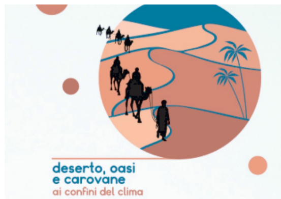
Immagine ufficiale del Festival

P arte dall'Africa e approda nel cuore della Puglia il viaggio del festival di Legambiente per il Sud: musica, letteratura e teatro, ma anche visite, degustazioni, laboratori in una sintesi fra ambiente e territorio. Il titolo di questa edizione è Out of Africa, Deserto, oasi e carovane, ai confini del clima . Dal 10 luglio al 3 agosto, tra Gargano e Valle d'Itria.